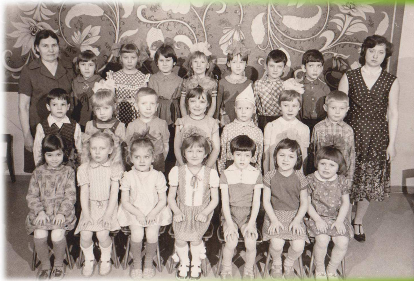
г.ГОРЬКИЙ 1983г Память о детском саде

Солнца лучик упал на рассвете, И как в сказке возник чудо – дом! В этот дом ходят с радостью дети, Детским садом его мы зовем!