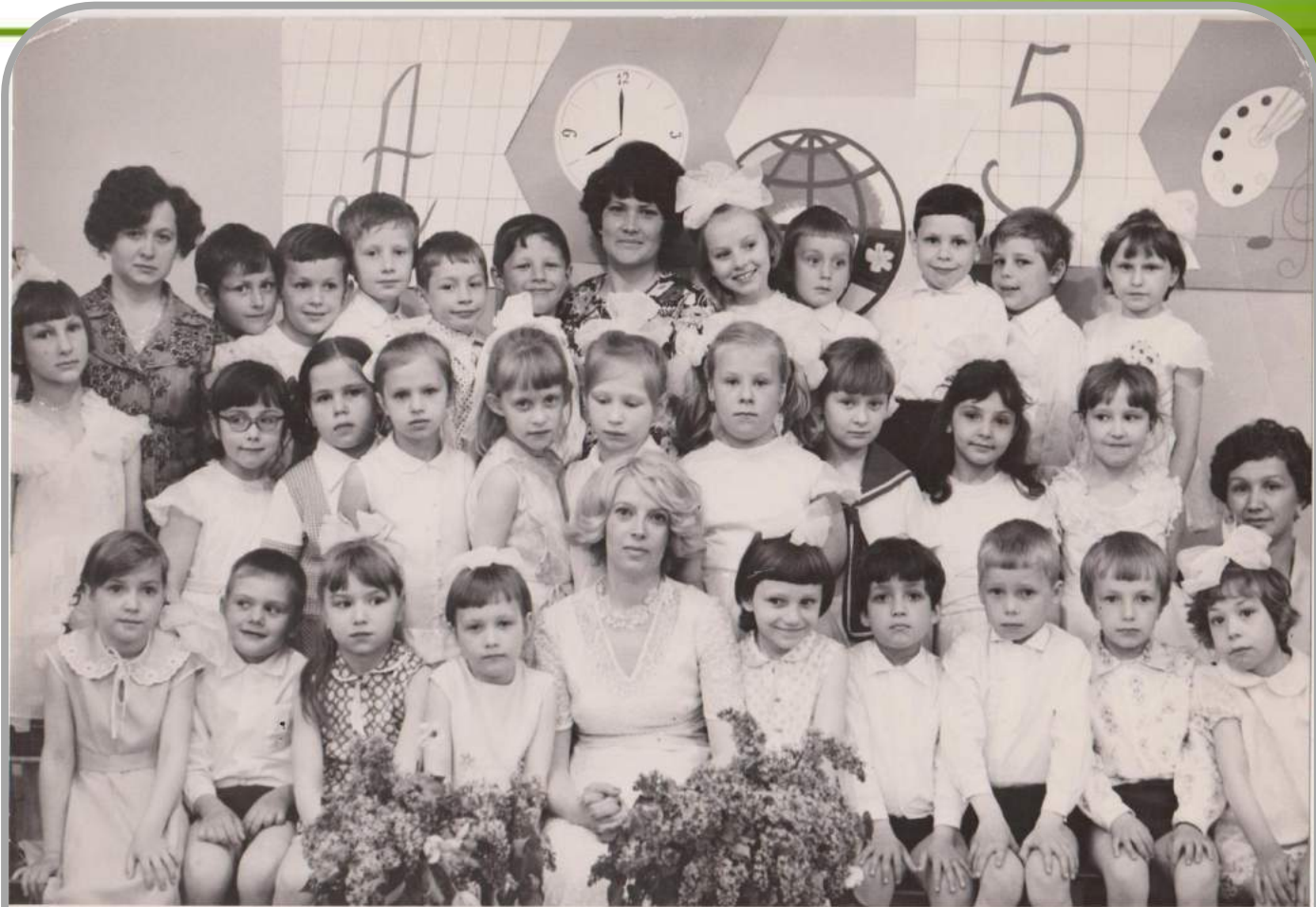
г. Юрький 1978 г. д/к 201

Свет Ваш горит не угасая, И нет вовек ему конца! Вы отдавали без остатка Работе - души и сердца!